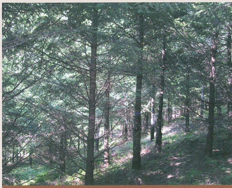
Peuplement dépressé classiquement en plein

On dépresse les peuplements quand ils mesurent entre 6 et 14 m de haut. En effet, il faut savoir que lorsque l'on plante 1600 douglas par exemple à l'hectare, c'est pour ne récolter que 250 tiges adultes 50 ans plus tard. Plus le peuplement est dense, plus il faut intervenir de façon précoce pour préserver la stabilité et l'intégrité des plus belles tiges. En règle générale, les arbres coupés sont de trop faible diamètre pour être commercialisés et ils sont abandonnés sur le parterre de la coupe après démantèlement.