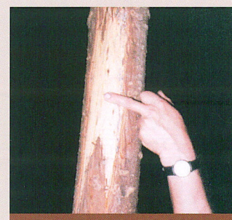
Dégâts d'écorçage sur Douglas dûs au cerf