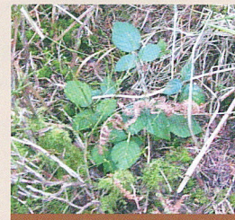
Apparition de ronce dans un pré-bois