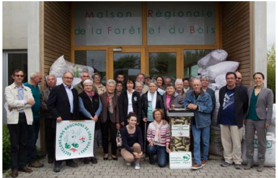
Photo de groupe devant les 82 sacs de 15 kg de la collecte de PEFC

L'UTAN, association représentant les usagers de la forêt au sein de PEFC, a initié en 1995 le projet de collecte des bouchons en liège afin que ceux-ci soient transformés et recyclés. L'UTAN comptait sur l'année 2015, pour les 20 ans de la collecte, rassembler en Champagne-Ardenne 20 tonnes de bouchons en liège pour permettre leur recyclage en France (opération 20 ans/20 tonnes). Le liège, matière première naturelle et écologique, peut être revalorisé sous forme de granulats pour divers matériaux : isolant acoustique et thermique, planchers... Produit à partir du Chêne liège présent sur le pourtour méditerranéen, ce matériau durable est récolté tous les 10 à 12 ans. En France, on compte plus de 5 000 ha de suberaies certifiées PEFC.