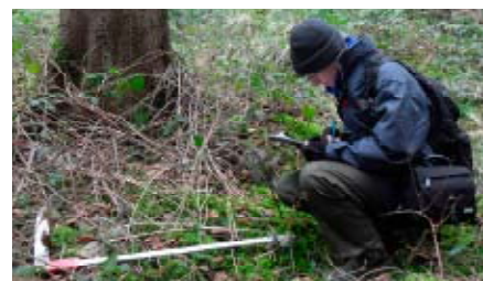
Un forestier effectue des relevés IC sur une placette

Je participe au dispositif Argonne nord, constitué de 81 points à faire en équipe de 2 personnes, mais la plupart des opérateurs travaillent seuls. Chaque opérateur dispose d'une grille de points sur lesquels il doit se rendre à l'aide d'un GPS.