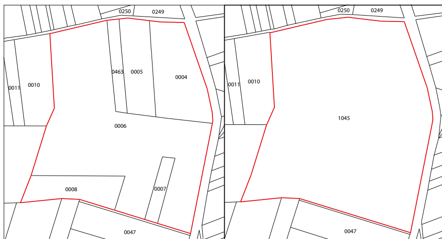
Dans cet exemple 6 parcelles ont été regroupées sous un seul numéro