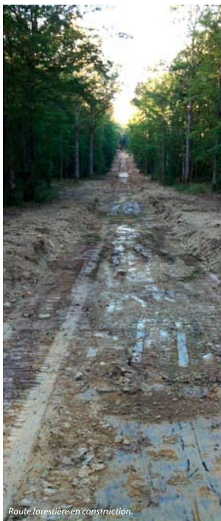
Route forestière en construction.

Une importante réforme sur la procédure des études d'impacts a été publiée en décembre 2011 (décret n° 2011-2019 du 29/12/11). Alors que cette procédure ne concernait pas jusqu'ici les pratiques forestières d'usage, désormais les routes forestières sont concernées en temps qu'« infrastructures routières », c'est-à-dire au même titre que toute autre route du domaine public ou privé. Ainsi, les routes d'une longueur égale ou supérieure à 3 km sont soumises d'office à étude d'impact, et celles de moins de 3 km sont soumises à « examen au cas par cas » : les propriétaires ou leur maître d'œuvre doivent produire un formulaire CERFA n° 14734*01 à destination des services de la DREAL (ex-Direction Régionale de l'Environnement) qui décidera alors, sur la base du descriptif du projet qui figure, s'il y a lieu ou non de produire une étude d'impact.