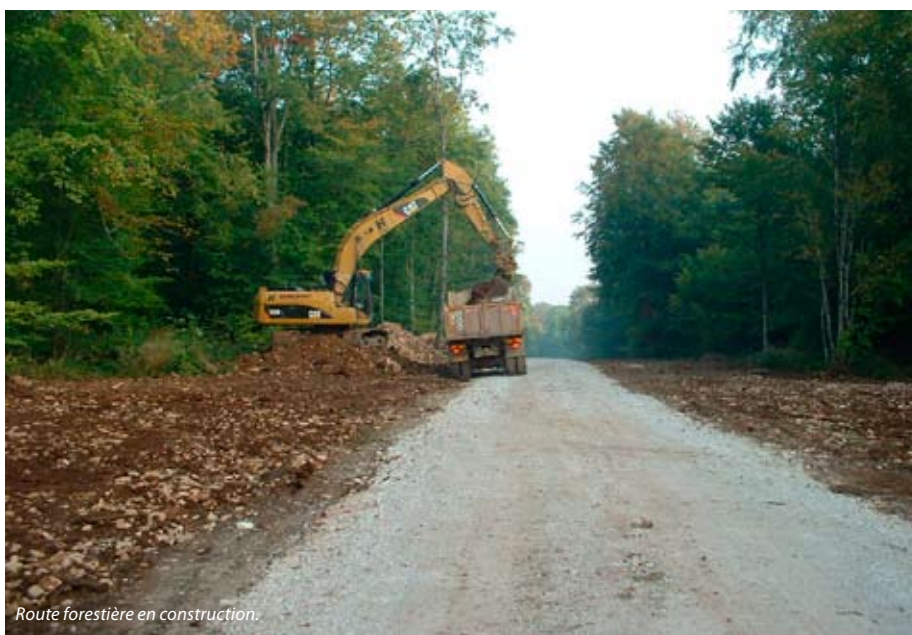
Route forestière en construction.

Il faut noter que la notion de cours d'eau inscrite dans cette loi n'est pas clairement définie, ce qui laisse place aux constructions prétoiriennes. Chaque département a ainsi établi sa cartographie des linéaires qualifiés officiellement de cours d'eau selon des critères qui lui sont propres. Pour l'appréciation des dossiers, la MISE (Mission Inter Service de l'Eau), qui regroupe des agents de la DDT et de l'ONEMA (Office National de l'Eau et des Milieux Aquatiques, anciennement les «garde-pêches»), est seule compétente en vertu de sa mission de Police de l'Eau.