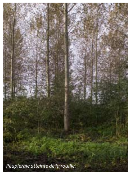
Peupleraie atteinte de la rouille.

Ces formations ou tests doivent être assurés par des organismes de formation habilités pour le certificat souhaité (liste consultable sur le site de la DRAAF). Pour les forestiers intéressés, la profession souhaite faire en sorte d'ici 2014 qu'un certain nombre de centres de formation agricole pour adultes (CFPPA) puissent adapter leurs formations au domaine forestier. Les organisations professionnelles et le CRPF pourront alors centraliser les demandes des forestiers, constituer un groupe de stagiaires au niveau régional et commander la formation adaptée. Les fonds de formation, VIVEA pour les non salariés cotisant à la MSA et FAFSEA pour les salariés, prennent en charge le coût de ces formations.