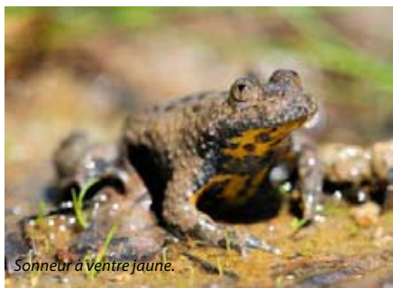
Sonneur à Ventre jaune.